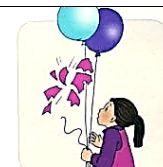
BALIONAS SPROGO. MERGAITĒ NUSTEBO.