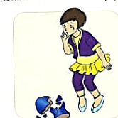
VAZA SUDUŽO. MERGAITĒ IŠSIGANDO.